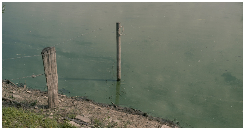
Filmstill Kali Waal , 2024