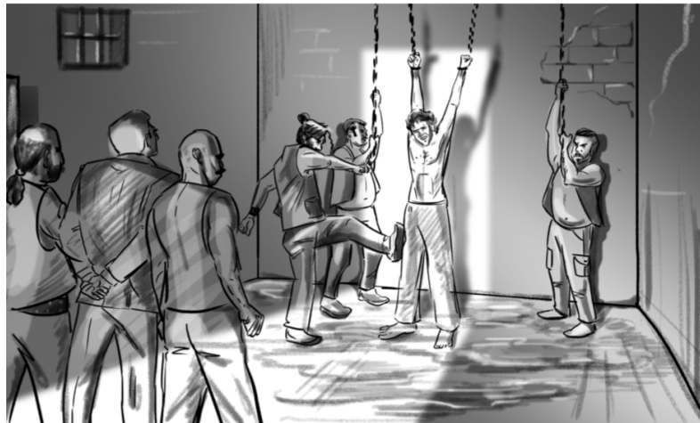
Draaiboek East of Noon

VRIZA genereerde financiering bij AFK en Mondriaan Fonds voor de ontwikkeling van het project maar had in 2019 nog onvoldoende credits opgebouwd om door het Filmfonds als "ervaren producent" erkend te worden. Daarom vroegen we seriousFilm om voor dit fonds de aanvragende partij te zijn. Het project werd geselecteerd voor De Verbeelding (een samenwerking van Mondriaan Fonds en Filmfonds) en kreeg een Production Incentive. VRIZA bracht financiering in van Fonds 21; Nu'ta film bracht private financiering in uit Egypte en DOHA postproductie financiering uit Qatar.