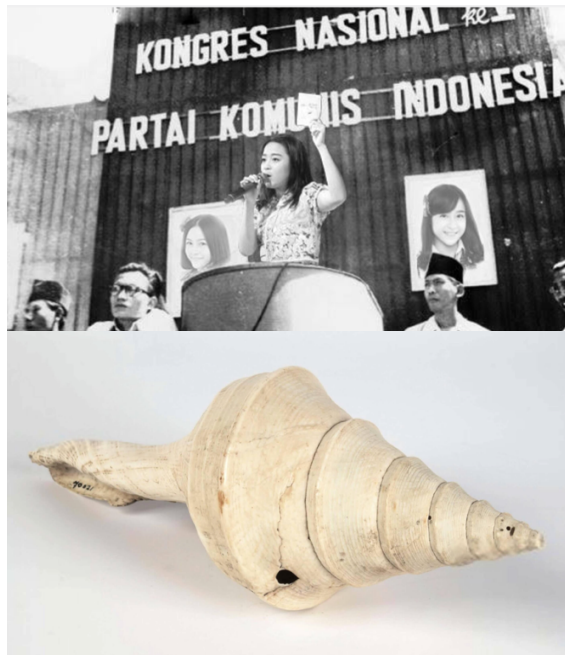
Research beelden Object Reconnaissance , 2022